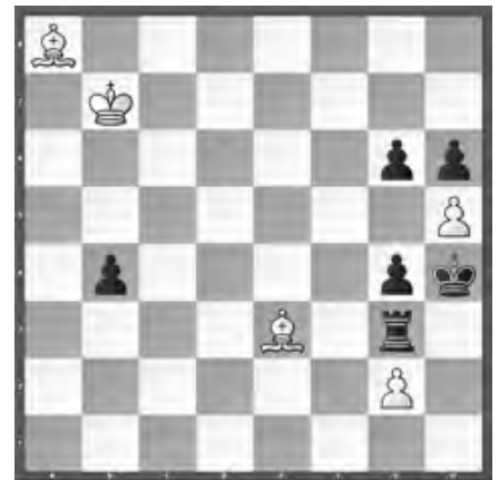
Weiss zieht und gewinnt

Lösungen mit Kommentaren bis 10. Dezember per E-Mail an roland.ott@swisschess.ch