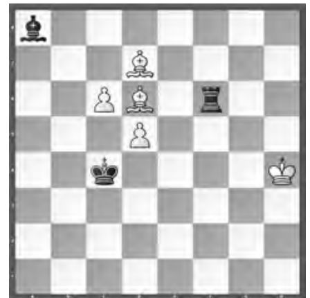
Weiss zieht und gewinnt