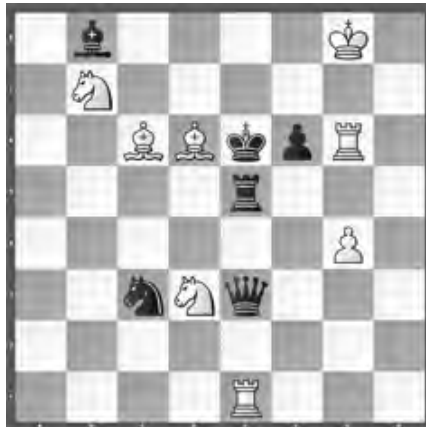
15163 Herbert Ahues Publikation post mortem