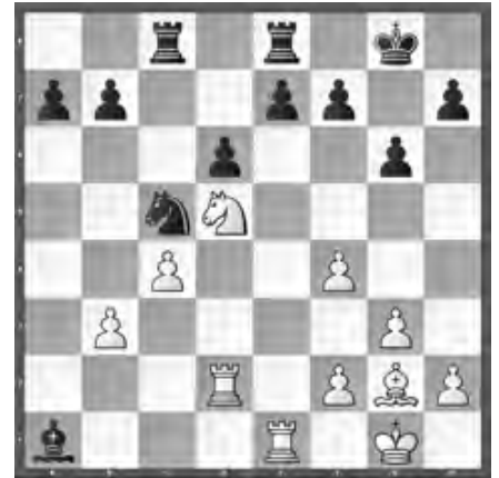
Buss – J. Novkovic SMM, Echallens – St. Gallen

Schwarz hat eine inkorrekte Kombination ausgeführt. Wie kann Weiss dies ausnutzen?