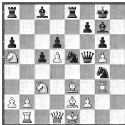
Degtjarew – Gähwiler SMM, Réti – Winterthur

Wie münzte Schwarz seine Überlegenheit in einen vollen Punkt um?