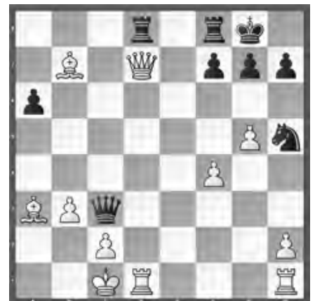
Petrow – Krämer SMM, Genf – Luzern

Weiss hat eine Figur mehr. Wie kann er diese verwerten?