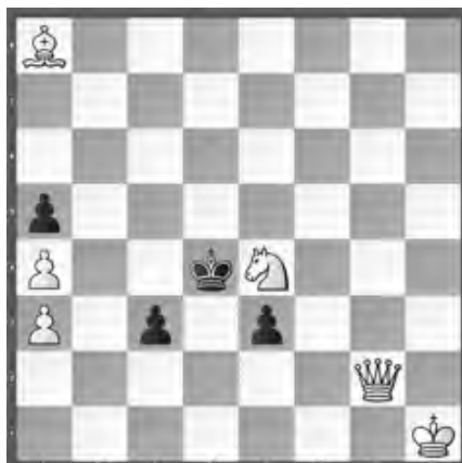
15167 Petrašin Petrašinović Belgrad (SRB)